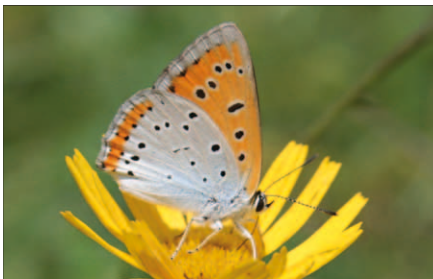
Abb. 5: Der Große Feuerfalter ( Lycaena dispar ) ist erst seit 2011 in Oberösterreich einwandfrei belegt worden. Die Art scheint sich aus Ostösterreich entlang des Donautales nach Westen auszubreiten, die Raupe lebt an Ampfer-Arten. Am 4. 8. 2012 konnten zwei Männchen im Südwestteil des Keltenweges nachgewiesen werden; im Bild eines davon an Rindsauge saugend.