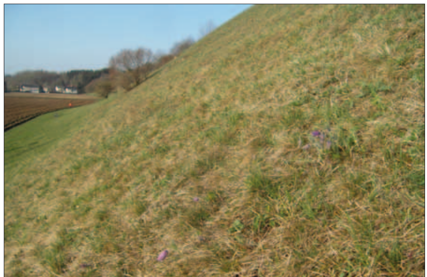
Abb. 12: Je nach Witterung blüht bereits ab Ende März die Kuhschelle; die Wiese ist vom Winter noch „strohig“. 28. 3. 2012, Keltenweg.