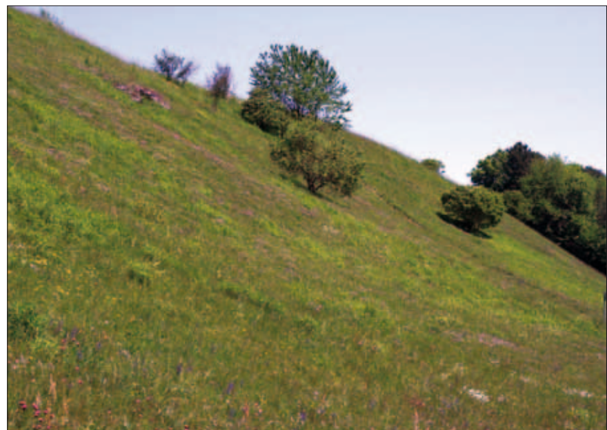
Abb. 10: Mitte Mai sind bereits die aufwachsenden Kanadischen Goldruten ( Solidago canadensis ) als hellgrüne Flecken zu erkennen. Die Art stammt aus Nordamerika und neigt zur Bildung von unerwünschten Dominanzbeständen. Nordöstlicher Bereich des Keltenweges, 20. 5. 2012.