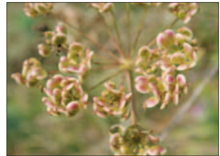
Abb. 8: Der Berg-Haarstrang ( Peucedanum oreoselinum ) ist ein in Halbtrockenrasen häufig anzutreffender Doldenblütler. Oft findet man an ihren Blättern die Raupen des Schwalbenschwanzes. Früchte, 5. 9. 2012, Keltenweg.

Die Zählung der Blüten im Jahr 2012 zeigte insgesamt die mit Abstand