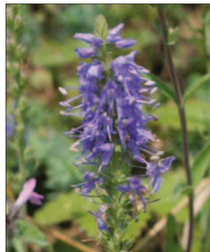
Abb. 18: Als in Oberösterreich vom Aussterben bedroht ist der Ährige Blauweiderich ( Veronica spicata ) eingestuft. Die Art ist – in einer wesentlich höherwüchsigen Form – in unseren Gärten und Parkanlagen auch als Zierpflanze verbreitet. Keltenweg, 4. 8. 2012.

Deutliche Zunahme der invasiven Kanadischen Goldrute ( Solidago canadensis ), besonders am Keltenweg (Hauptgang und vorgelagerte Böschung). Es besteht dort dringender Handlungsbedarf, am geeignetsten durch Vorverlegung der Mahd in die erste Julihälfte (beide Böschungen am Keltenweg). Am Kreuzberg sollten