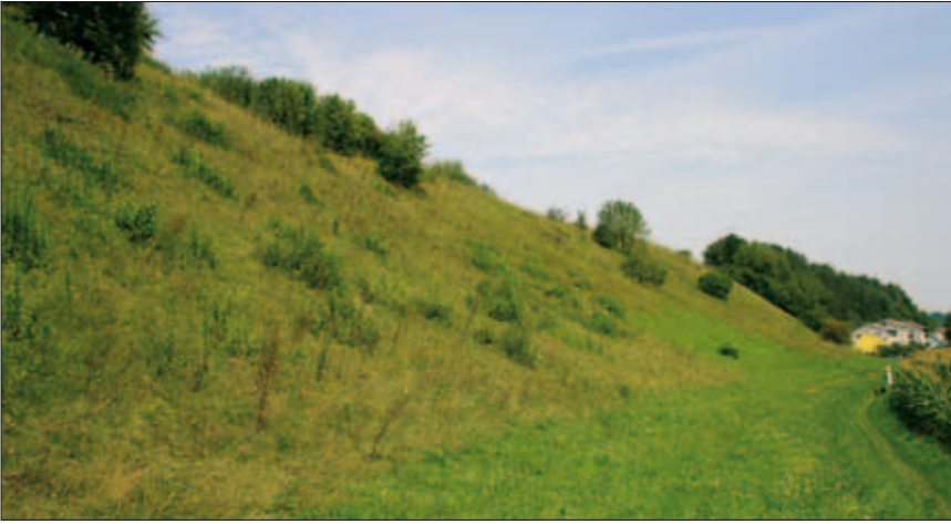
Abb. 20: An den 1992 gerodeten Stellen treiben besonders in feuchten Sommern die sich im Boden befindlichen Gehölz-Stöcke wieder durch, allen voran der Blutrote Hartriegel ( Cornus sanguinea ). Die Herden der Kanadischen Goldrute waren zum Zeitpunkt der Aufnahme bereits abgemäht. Keltenweg, Blick nach Nordosten, 4. 8. 2012.