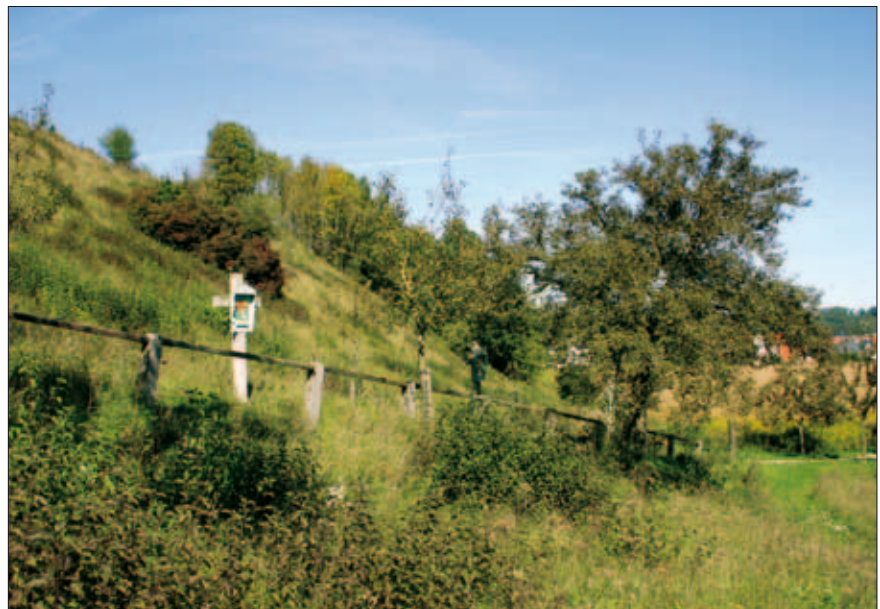
Abb. 26: Herbststimmung am Kreuzberg wenige Wochen vor der Mahd. Die Blätter der Gehölze beginnen sich bunt zu färben. 25. 9. 2012.

( Pulsatilla vulgaris MILL.) in Österreich von 1991-2005. Linzer biol. Beitr. 37(2): 1145-1176.