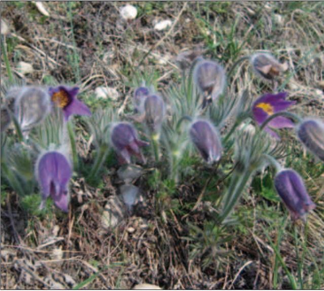
Abb. 14: Älterer Stock der Bayern-Kuhschelle ( Pulsatilla vulgaris ) mit nickenden Blüten zum Blühbeginn. 28. 3. 2012, Keltenweg.