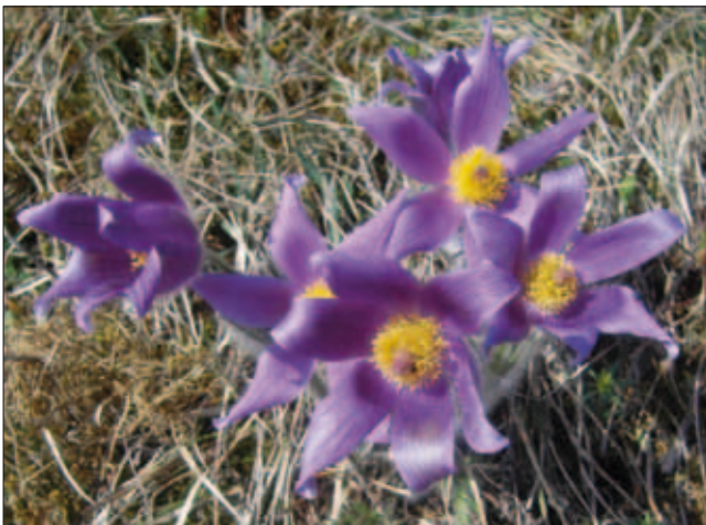
Abb. 1: Seidiger Glanz frischer Blüten der Bayern-Kuhschelle ( Pulsatilla vulgaris ). 28. 3. 2012, Kreuzberg.