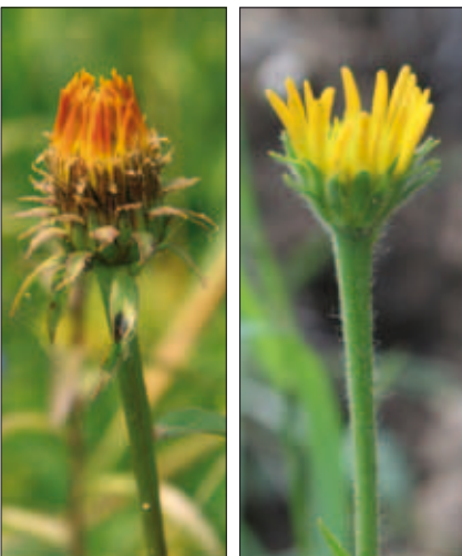
Abb. 22 und 23: Die beiden aufgeblüht recht ähnlichen gelben Korbblütler-Arten Weidenblatt-Alant ( Inula salicina ) und Rindsauge ( Bupthalmum salicifolium ) sind im Knospenstadium leicht unterscheidbar. Alant-Knospe, Keltenweg 11. 6. 2012 (links); und die Rindsaugen-Knospe, Keltenweg, 11. 6. 2012 (rechts).