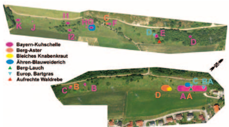
Abb. 13: Fundorte der „elitären“ Pflanzenarten am Kreuzberg (oben) und am Keltenweg.