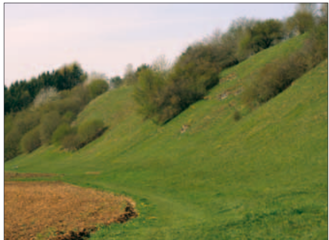
Abb. 2: Südwestlicher Teil des Keltenweg-Hanges im April. Die Mahd hat im vorangegangenen Oktober stattgefunden. 18. 4. 2012.