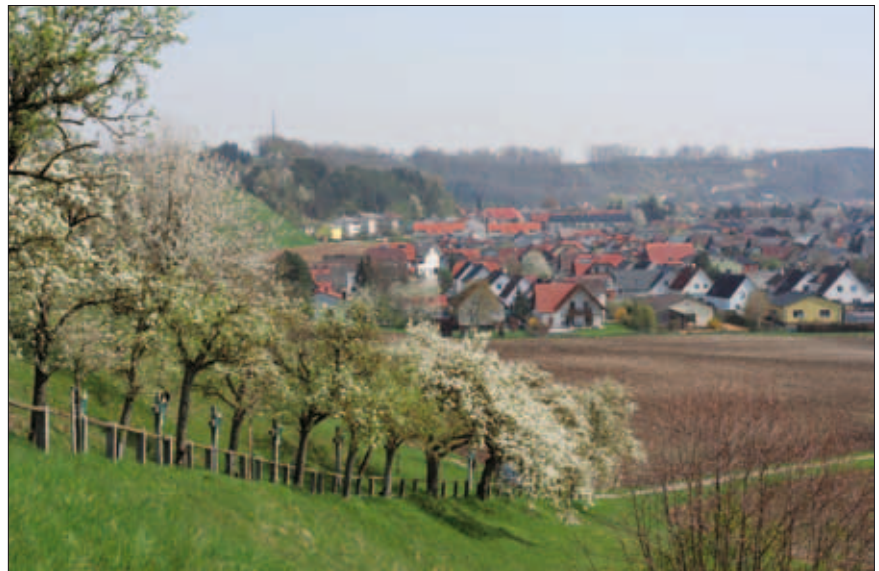
Abb. 11: Streuobstblüte am Kreuzberg. 18. 4. 2012.

Der Berg-Lauch ( Allium lusitanicum , = A. senescens ssp. montanum – Abb. 16) ist im Untersuchungsgebiet nur von einem einzigen Felsrasen auf einer Konglomeratstufe im nord-östlichen Hangteil beim Keltenweg kleinflächig nachgewiesen (Abb. 13). 1998 und 1999 waren dort 70 bzw. 84 Blühtriebe zu finden. Am 4. 8. 2012 konnten etwa 320 (!)