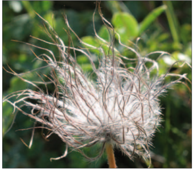
Abb. 15: Reifer Fruchtstand der Bayern-Kuhschelle. Die umgangssprachlich als „Samen“ bezeichneten Früchte (Nüsschen) werden durch den Wind verbreitet. Sie sind nur wenige Jahre keimfähig. Keltenweg, 20. 5. 2012.

Blühtriebe oberhalb der Konglomeratstufe meist im Felsrasen wachsend gezählt werden. Der Bestand ist also gesichert.