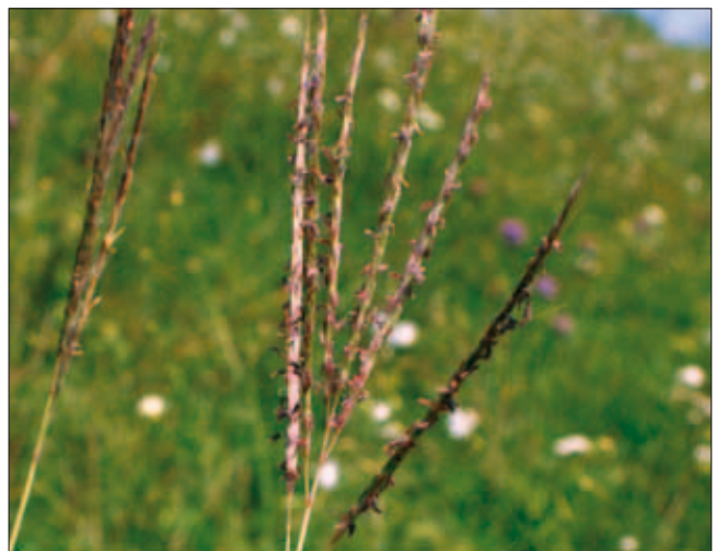
Abb. 17: Das Wärme liebende und in Oberösterreich stark gefährdete Europäische Bartgras ( Bothriochloa ischaemum ) hat handförmig angeordnete Ähren. Es fruchtet frühestens ab Ende August, treibt aber nach einer Sommermahd rasch mit Blühtrieben wieder aus. Keltenweg, 4. 8. 2012.