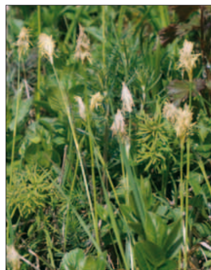
Abb. 19: Die in Oberösterreich stark gefährdete Micheli-Segge ( Carex michelii ) blüht schon zeitig im Jahr in getrenntgeschlechtlichen Blütenständen der einhäusigen Pflanzen. Auf dem Foto sind nur die gelblich stäubenden, endständigen männlichen Blütenstände deutlich sichtbar, darunter befinden sich die unscheinbar grünen weiblichen.

bei Fortsetzung der Herbstmahd die Goldruten im Juni händisch entfernt werden (Ausreißen bei feuchter Witterung). Diese Maßnahmen sollen langfristig durchgeführt und alle 5 Jahre dokumentiert werden. Beim Blauweiderich ( Veronica spicata ) und bei der Berg-Aster ( Aster amellus ) sollte der Reproduktionserfolg nach einer Sommermahd beobachtet werden, ob also bis zum Herbst noch eine Nachblüte mit Samenbildung zustande kommt (dies ist beim Bartgras und beim Blutstorchenschnabel nach eigenen Erfahrungen der Fall).