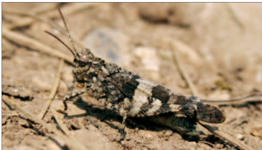
Abb. 3: Die seltene Blauflügelige Ödland-Heuschrecke ( Oedipoda caerulea ) konnte heuer erstmals am Heinrich Sperer-Weg und in dessen Umgebung auf Offenflächen mehrfach nachgewiesen werden. Keltenweg, 4. 8. 2012.

3: verbuschender Trespen-Halbtrockenrasens (in der typischen Ausbildung), nur am Kreuzberg. Unbewirtschaftet.