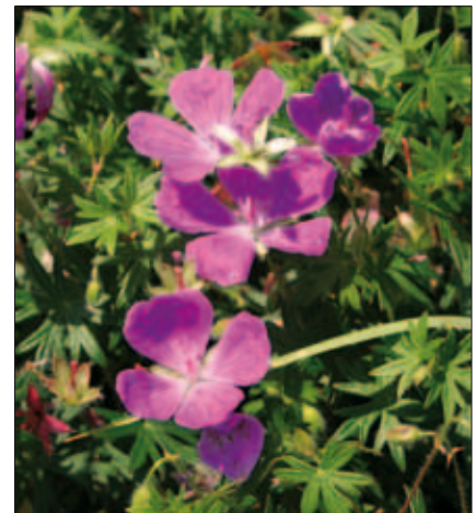
Abb. 9: Der Blutrote Storchenschnabel ( Geranium sanguineum ) hat seinen Namen wegen der im Sommer und Herbst oft blutrot gefärbten Blätter und die schnabelartig gestreckten Früchte. Er kommt in reich blühenden Beständen vor allem im Nordostteil des Keltenweges vor. Keltenweg, 11. 6. 2012