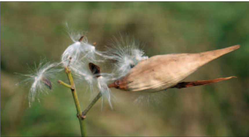
Abb. 21: Die giftige Schwalbenwurz ( Vincetoxicum hirundinaria ) wurde früher als Arzneipflanze gebraucht. Sie hat Samen mit Haarschopf, die durch den Wind verbreitet werden. Keltenweg, 5. 9. 2012.