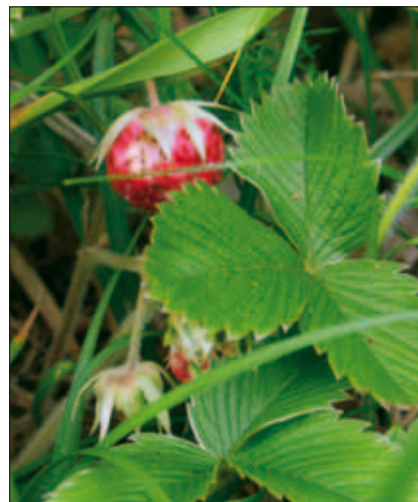
Abb. 24: Die Knack-Erdbeere ( Fragaria viridis ) ist eine der drei einheimischen Erdbeerarten. Sie reißt beim Pflücken mitsamt den Kelchblättern mit einem Knackgeräusch ab, daher der deutsche Name. Sie ist wie die beiden anderen wohlschmeckend und gilt in Oberösterreich als stark gefährdet. Kreuzberg (Nordost-Ende), 11. 6. 2012.

Der dichte Gehölzaufwuchs von einjährigen Trieben vor allem des Blutroten Hartriegels ( Cornus sanguinea ) nimmt an ehemaligen Rodungsstellen zu (Abb. 20). Handlungsbedarf: künftige Mahd in der ersten Julihälfte (empfohlen beim Keltenweg) oder Abschlagen mit der kurzen Sense in der ersten Julihälfte (ähnlich wie 2012 bei der Kanadischen Goldrute beim Haupthang am Keltenweg).