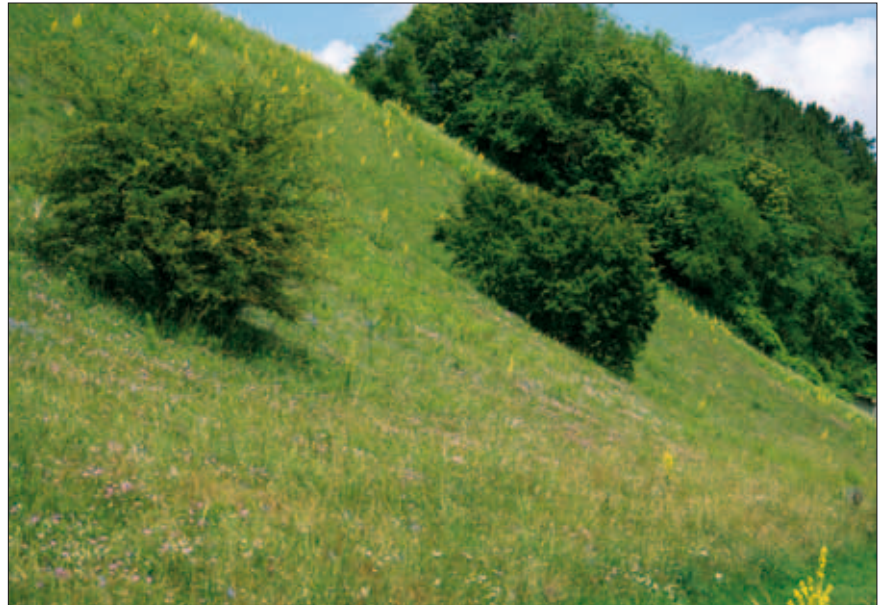
Abb. 25: Mitte Juni ist die Wiese bunt von blühenden Flockenblumen, Großem Ehrenpreis und Heide-Königskerze. Nordost-Ende Keltenweg, 11. 6. 2012.