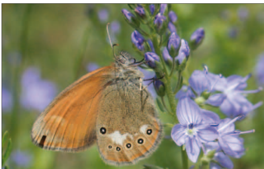
Abb. 4: Auffällig häufig ist im Untersuchungsgebiet das Rostbraune Wiesenvögelchen ( Coenonympha glycerion ), eine in Oberösterreich gefährdete Art.