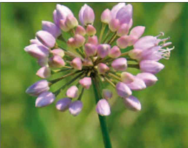
Abb. 16: Von mehreren Lauch-Arten ist der Berg-Lauch ( Allium lusitanicum ) im Gebiet wohl die bemerkenswerteste. Er kommt hier nur an einer Stelle oberhalb einer niedrigen Konglomeratstufe vor. Keltenweg, 4. 8. 2012.

Das frühestens im August blühende Europäische Bartgras ( Bothriochloa ischaemum – Abb. 17) wurde erst-